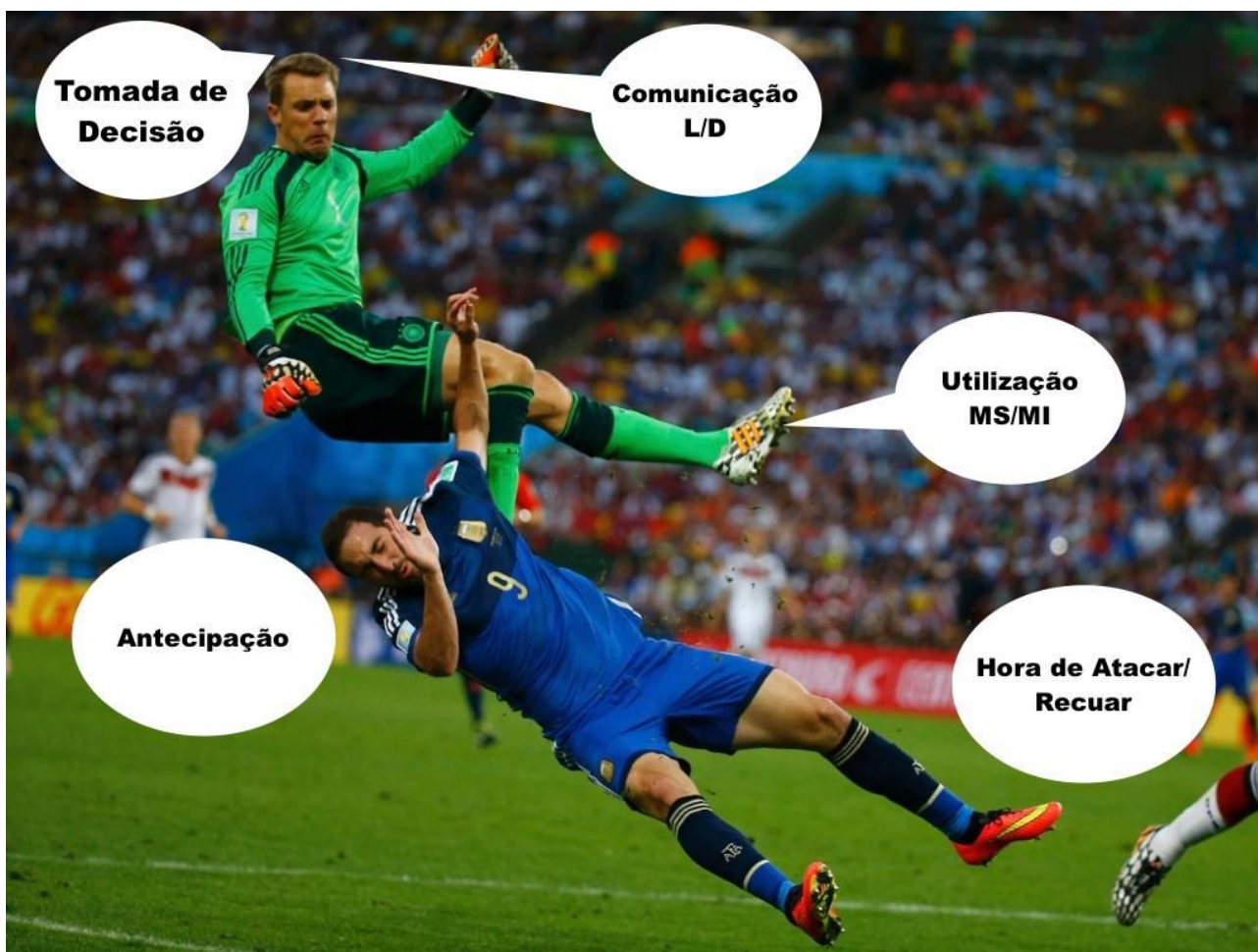
Manuel Neuer é referência na jogabilidade com os pés e coberturas defensivas, segundo o Instat sua melhor habilidade é jogar fora da grande área. Sua média de acerto por jogo nos passes são de 92%.

Pressão média, marcação na zona defensiva, aonde queremos chegar com isso?! O que o goleiro tem a ver com a marcação?!